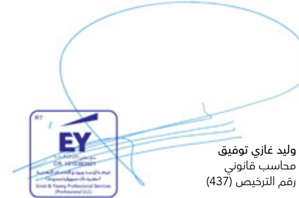
وليد غازي توفيق محاسب قانوني رقم الترخيص (437)